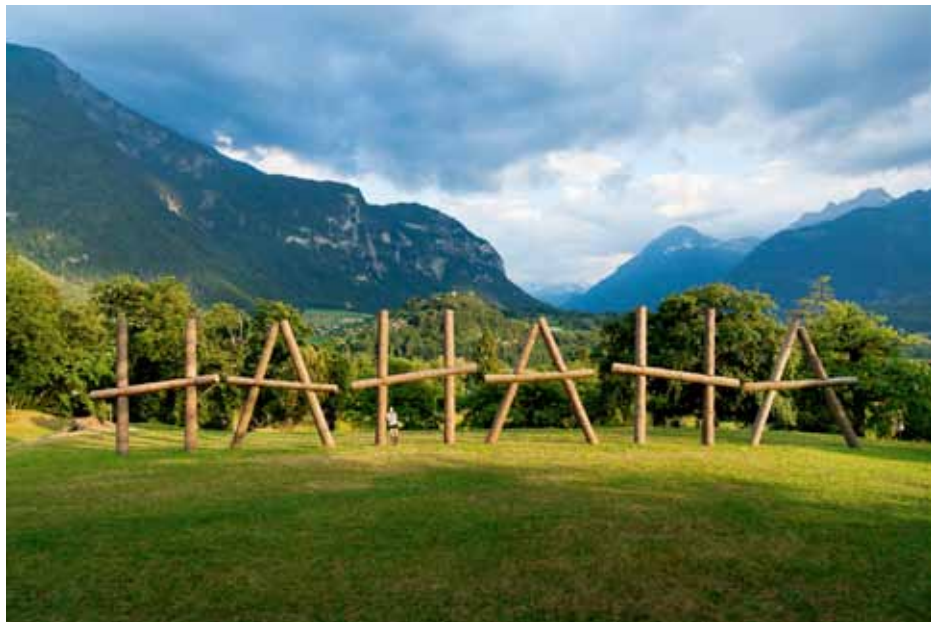
Claudia Comte HAHAHA , 2014 18 troncs d'épicéa, pour Bex & Arts 2014 , Bex, Suisse © Claudia Comte Photo : Gunnar Meier Courtesy the artist